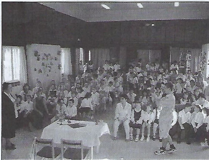
Évnyitó az iskolában