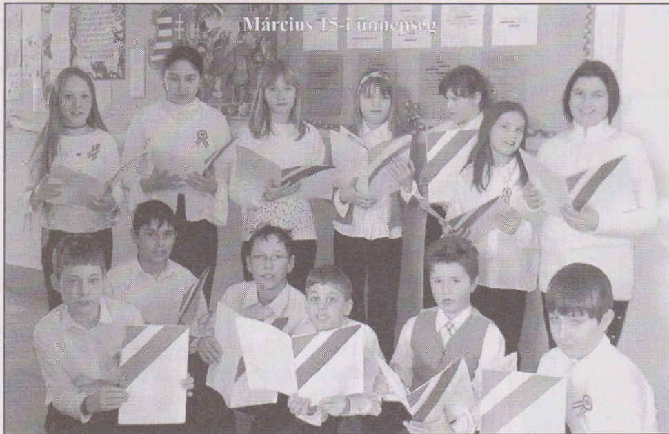
Március 15-i ünnepség

Személyes történettel kezdem, remélem nem veszik zokon. A nagymamám, aki már régen nem él, az a fajta asszony volt, aki maga szötte - hímzte a háztartásban használt textilkiat.