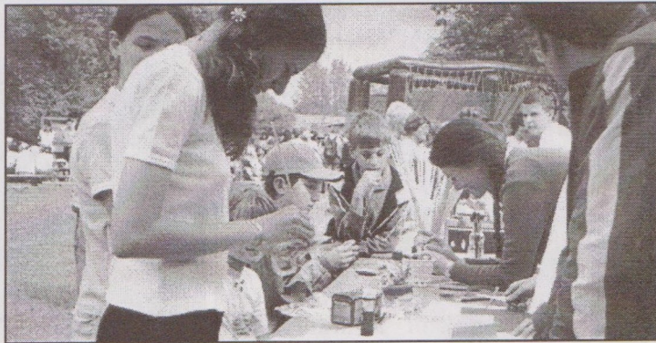
A kézműves-foglalkozások is nagy sikert arattak