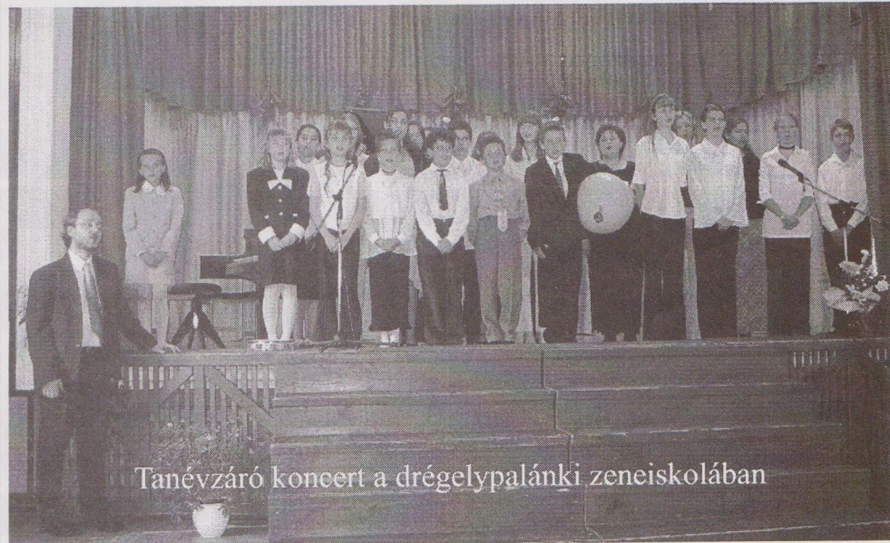
Tanévzáró koncert a drégelypalánki zeneiskolában